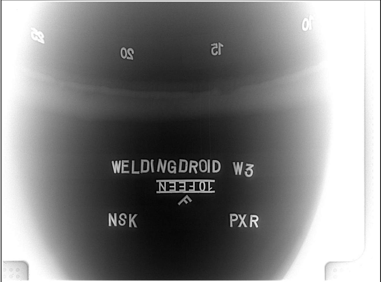
W3 - example